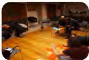
SESION 1 DAFO grupal