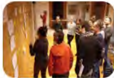
SESION 1 Principios y valores