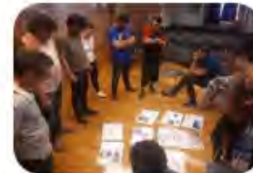
SESION 4 Preparación visita