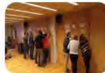
SESION 2 Comunicación y sensibilización