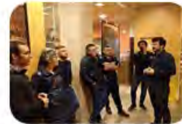
SESION 2 Identificación de Agentes