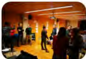
SESION 3 Flujograma de acciones