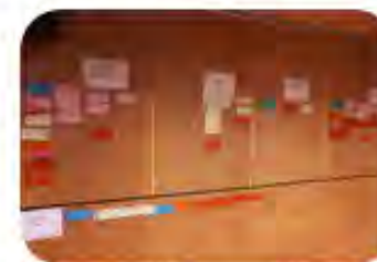
SESION 4 Cronograma y agenda