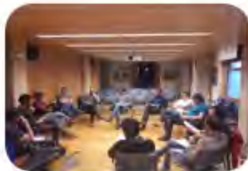
SESION 3 Participación